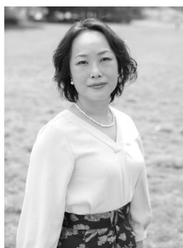
ソプラノ 川原千晶