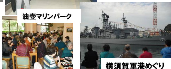
横須賀軍港めぐり