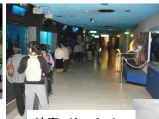
油壺マリンパーク