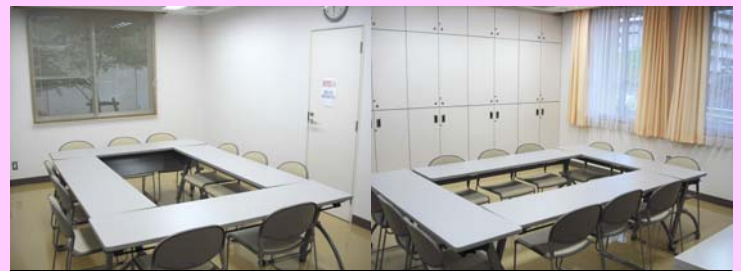
地域ケアルーム(20名程度)