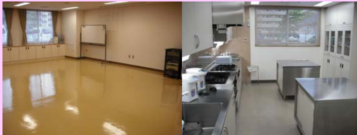
多目的ホール (60名程度)

活動場所をお探しの方、これから活動を始めようと思っている方、ぜひ一度ご相談ください！