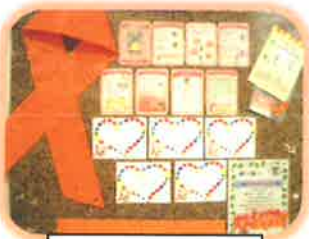
メッセージカード

「子どもへの虐待をなくしたい」その気持ちを込めて2005年に始まった「オレンジリボンキャンペーン」は、現在全国に広がっています。本牧・根岸地区でも、子ども虐待のない社会に向けて、子育て応援事業等に参加している方の力をかりて「オレンジリボンメッセージカード」を作成。ケアプラザでのメッセージカードの掲示を通して【地域で子どもを見守る】輪を広げていきます。