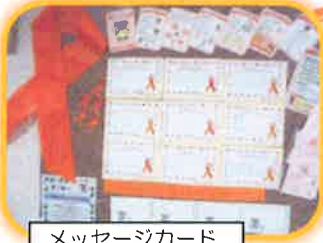
メッセージカード

「子どもへの虐待をなくしたい」その気持ちを含めて2005年に始まった「オレンジリボンキャンペーン」は、現在全国に広がっています。本牧・根岸地区でも、子ども虐待のない社会に向けて、子育て応援事業等に参加している方の力をかりて「オレンジリボンメッセージカード」を作成。ケアプラザでのメッセージカードの掲示を通して【地域で子どもを見守る】輪を広げていきます。